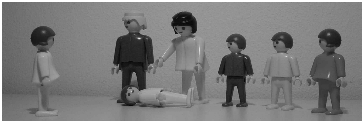
Constelación estructural con muñecos de Playmobil

Por supuesto que de esta manera no se pueden hacer constelaciones grandes y complejas, pero sí mirar y tratar temas claros y sencillos. Este método de trabajo ha demostrado su utilidad como complemento de una constelación con representantes. Además es importante que el cliente se conecte con la estructura distanciándose de la manera egoíca de percibir. De tal manera es posible conseguir la misma conexión con el campo del conocimiento.